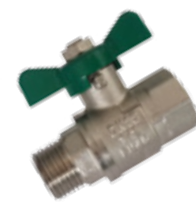
R. sk: N1BB