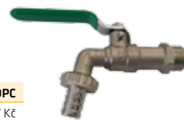
R. sk: N1BB

Podrobný popis výrobků a jejich použití je popsán v dostupných technických listech. Ceny uvedeny bez DPH. Změna cen vyhrazena.