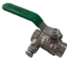
R. sk: N1BB