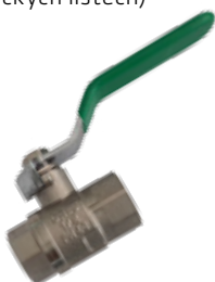
R. sk: N1BB