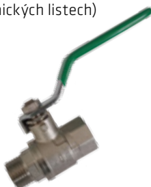
R. sk: N1BB