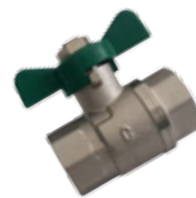
R. sk: N1BB